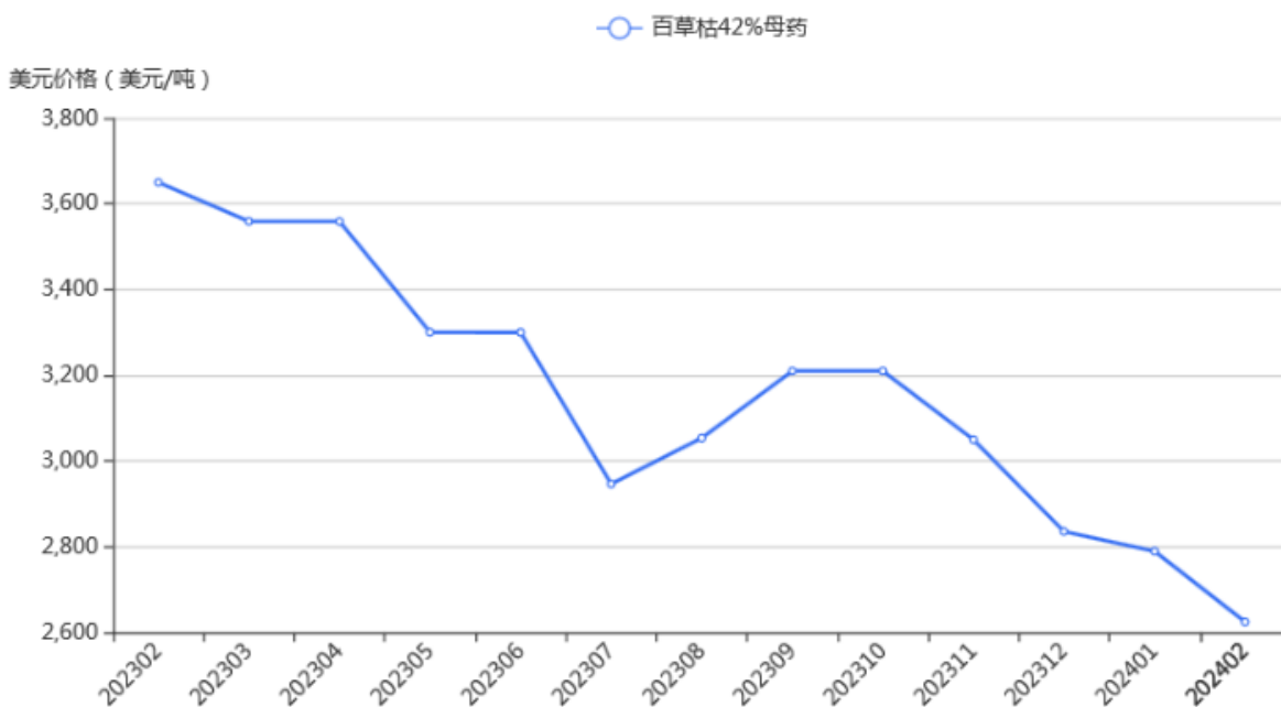
FIGURE 1: 2023年2月到2024年2月中国百草枯母药42%的FOB价格走势

关于吡啶，据西美信息本月监测，吡啶生产企业的出厂报价比上月环比略有下降。其下游百草枯母药市场的低迷使吡啶出厂价格停止上涨。到2月，其环比出现下跌，幸好幅度有限；预计3月，吡啶的出厂价格有陆续走稳的趋势。