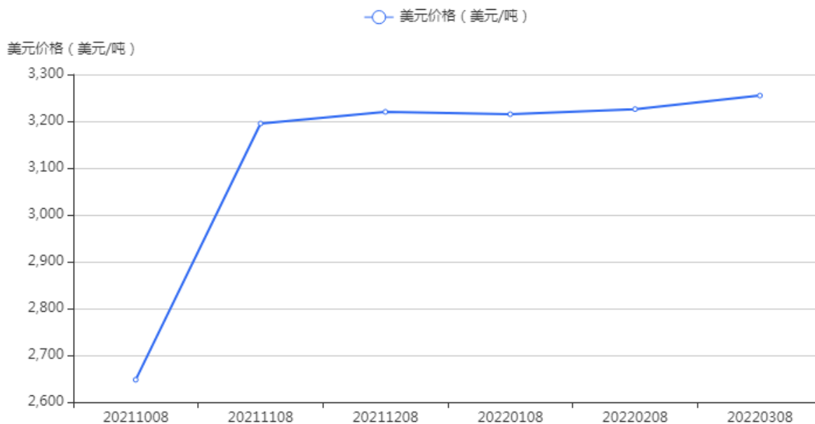
FIGURE 2: 2021年10月至2022年3月42%百草枯母液的FOB价

百草枯母液3月FOB价格为3,254.76美元/吨，仍维持价格高位，环比上月价格上涨0.90%。