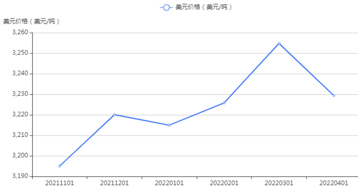
FIGURE 1: 2021年11月至2022年4月42%百草枯母液的FOB价

百草枯母液4月FOB价格为3,229.39美元/吨，仍维持价格高位，环比上月价格下降0.78%。